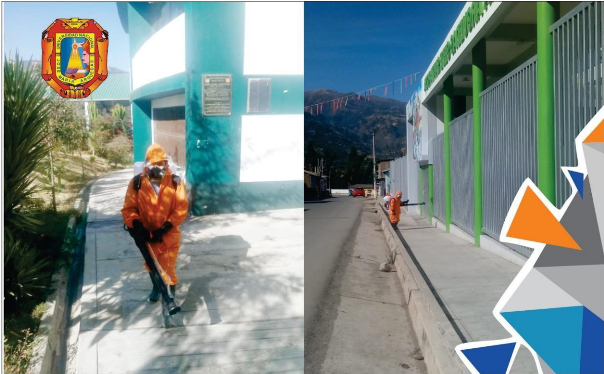
FUMIGACIÓN DE LA SEDE PREVIO AL EXAMEN