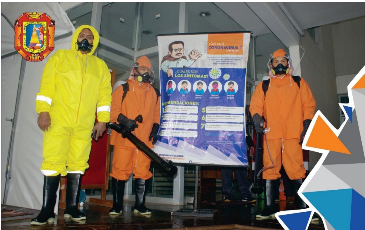
FUMIGACIÓN DE LA SEDE PREVIO AL EXAMEN